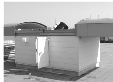
Fig.1 Observatory and Schmidt-Cassegrain telescope

天体を視野中央に導入するためには視野の広い（低倍率の）ガイドスコープを利用する必要がある。ガイドスコープに天体を導入した後、視野の狭い（高倍率の）主望遠鏡で、天体を視野中央に導入する。リレーボード内蔵の制御BOXによりビデオ信号をモニタカメラ、ガイドスコープと主望遠鏡（あるいは太陽望遠鏡）のどれか1つと切り替えて、動画を配信する。主望遠鏡の撮像装置としては、長時間露光可能な冷却 CCD カメラ（あるいはデジタル一眼レフカメラ）を使用する。また、天文台運営上不可欠な気象観測装置の組み込みについては、現在、卒業研究生が作業を進めている。通常のア天文台としては今年度5回計画の公開講座「天体観測会－君も未来のガリレオだ！－」をスタートさせている。なお、本研究は科研費（20500769）の助成を受けたものである。